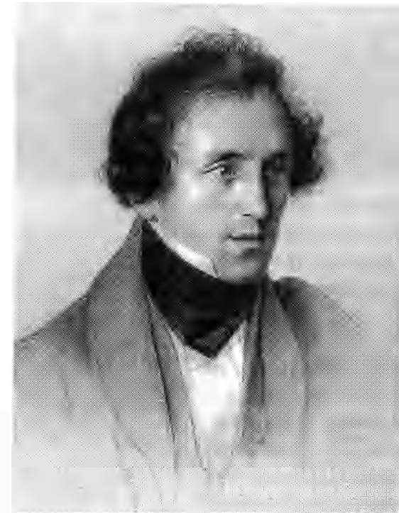
Felix Mendelssohn Bartholdy